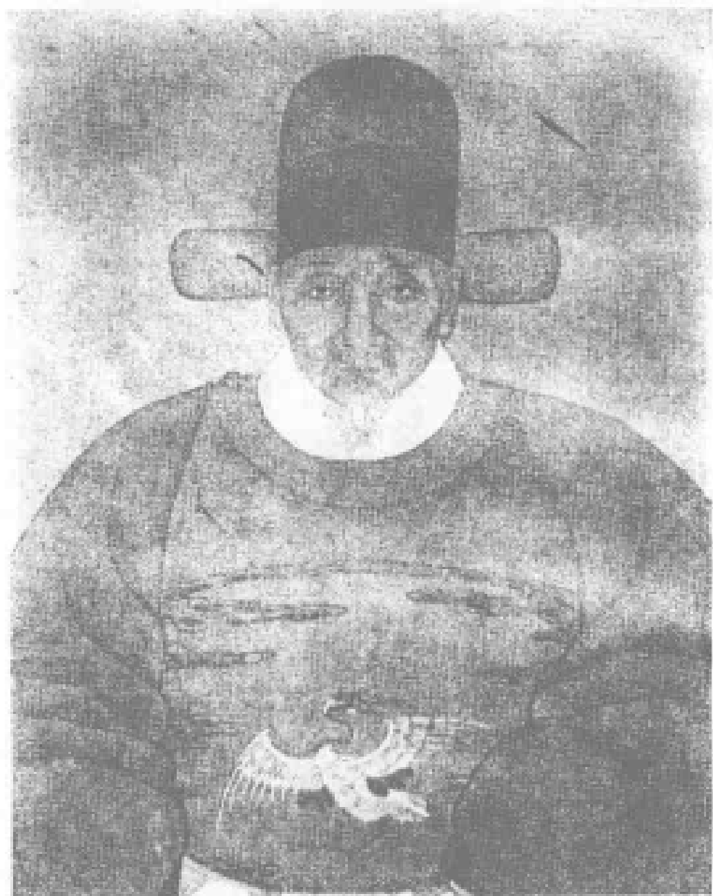
明繪徐光啓像 (彩繪原像為徐氏故宅大殿楹物)